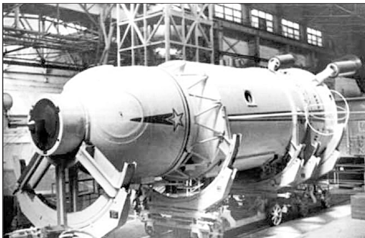
Многоместный военно-исследовательский корабль «Звезда» 7К-ВИ.

В 1967 году Козлов создал военный космический корабль с пушкой калибра 23 мм. Его цель — оборона советских и уничтожение аппаратов противника в космосе. Это был боевой комплекс «Звезда», который свернули при Горбачёве. А ведь, как утверждают специалисты, он бы довольно серьёзно продвинул СССР, а затем и Россию в вопросах космических программ, связанных как с обороной, так и с безопасностью страны.