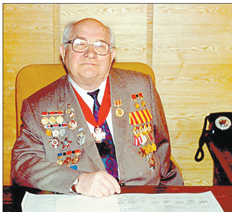
Дмитрий Ильич Козлов. Автор: https://историческая-самара.рф/каталог/самарская-персоналия/к/козлов-дмитрий-ильич.html

Сегодня российские стратегические ядерные силы — это основа безопасности страны.