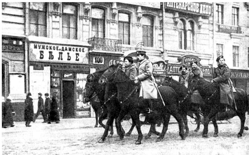
Конный патруль на Невском проспекте.

«Воронеж. В выпускаемых редакцией «Воронежских губернских ведомостей» телеграммах Российского и Петербургского телеграфных агентств администрацией вычеркиваются все сообщения, касающиеся последних событий в Петербурге, Москве, Ковне и Вильне; не печатаются даже официальные сообщения. . . ».