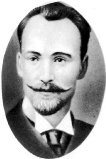
Н. Э. Бауман.

вспомнить долг перед Родиной, помочь прекращению сей неслыханной смуты...». Этот «долг» они исполняли, убивая и калеча рабочих, студентов, интеллигентов, «инородцев», грабя и уничтожая лавки, магазины, квартиры. Они пытались контрреволюционным террором запугать восставших трудящихся, остановить разворачивающуюся революцию. Читая сообщения о бесчинствах монархистов-погромицков,