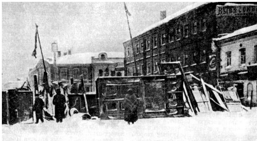
Баррикады у Садово-Каретной в дни Декабрьского вооруженного сосстания в Москве. 1905 г.

...К вечеру артиллерия сняла все баррикады по Садовой и на Неглинном проезде.