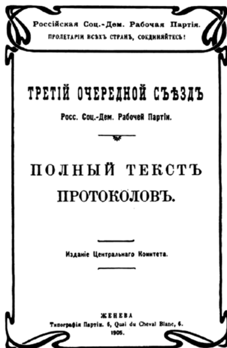
Обложка книги «Третий очередной съезд РСДРП. Полный текст протоколов». Изд. ЦК, Женева, 1905 г.

Материалы и решения III съезда РСДРП оснастили большевистские организации необходимым идеологическим оружием, обосновали тактику борьбы и показали стратегические перспективы развития революции.