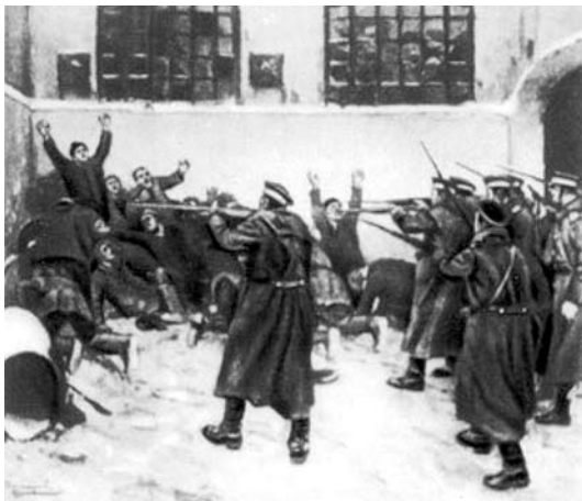
И. Владимиров. Расстрел рабочих во дворе фабрики Прохорова в 1905 г.

журку, за красные рубахи, за красный платок в кармане, за смуглый цвет кожи. Били солдаты, полиция, черносотенцы. Бюро медицинского союза сообщало, что было убито 992 мужчины, 137 женщин и 86 детей. Так царизм мстил своему народу за порыв к свободе.