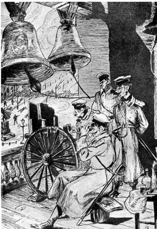
Обстрел баррикад с колокольни Страстного монастыря. С рисунка Н. Шестопалова

Окольными путями я добрался домой, а потом и на Николаевский вокзал...». Журналист «Биржевых Ведомостей» замечает, что очевидец – человек не