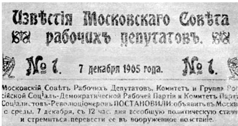
Выпуск «Известий» с постановлением Моссовета о вооруженном восстании. Фотокопия

державнейшего Государя Императора, православный Московский народ собрался для общей молитвы за Царя на Красную площадь». Были произнесены надлежащие речи штатных ораторов, были выражены одобрения всем действиям правительства, а генерал-губернатор Дубасов пообещал сохранить порядок и спокойствие. Однако 7 декабря Москва забастовала.