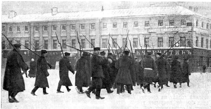
Вооружённые рабочие на улицах Москвы в дни Декабрьского восстания. 1905 г.

Войска все чаще применяли артиллерию, разбивая баррикады, расстреливая дома и фабричные здания, где