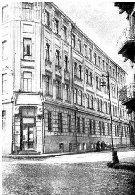
Реальное училище Фидлера (угол Мыльниковой и Лобковского переулков). Фотоснимок

предложили сдать оружие и удалиться. Сидевшие на митинге отвечали отказом. Тогда им был дан час на размышление, но за 5 минут до истечения срока из дома Фидлера стали стрелять в войска из винтовок и револьверов. Войска ответили боевыми залпами. Из дома были брошены последовательно две бомбы... Тогда с Машкова переулка... были сделаны четыре орудийных выстрела гранатами. Снаряды вышибли все стекла и